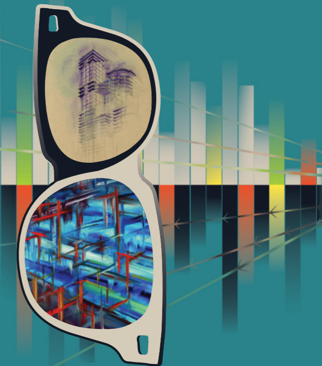
Ausstellung Behind His Glasses. Von Skizzen, Vorbildern und Konrad Zuses Konstruktion der Welt.

Der Entwicklungsweg dieser Maschinen hin zu Alltagsbegleitern, Spielekonsolen, Bürohelfern oder sprechenden Assistenten wird an den gesellschaftlichen Begleiterscheinungen der Gegenwart und des 20. Jahrhunderts aufgezeigt.